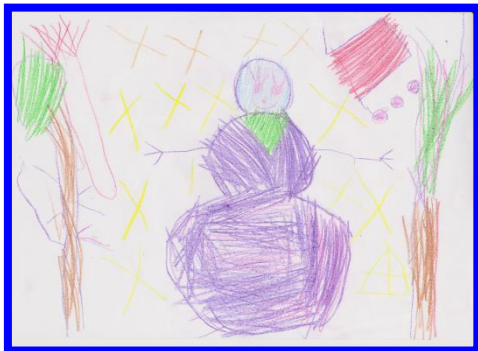
ANAJA TEODORVIČ AVSENAK