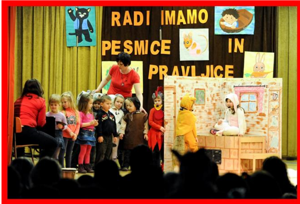
DRAMATIZACIJA PRAVLJICE ZAJČKOVA HIŠICA

Otroci so z veseljem kar trikrat nastopali pred množico ljudi. Zapomnili so si veliko besedila ter lepo prepevali in igrali na male ritmične inštrumente. Na odru so bili zelo sproščeni in ustvarjalni.