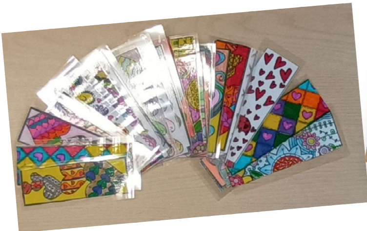
KNJIŽNA KAZALA ČETRTOŠOLCEV