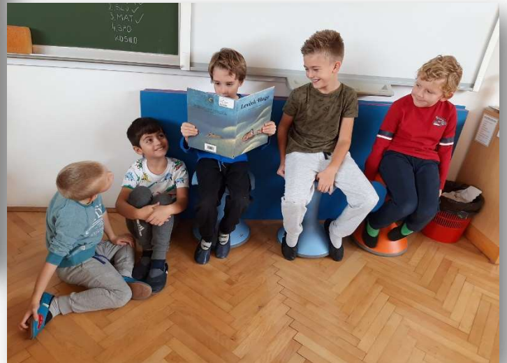
KNJIŽNA KAZALA DRUGOŠOLCEV