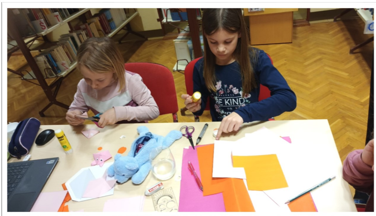
UČENKE MED IZDELOVANJEM KNJIŽNIH KAZALK

Čas nam je minil, kot bi mignil. Prijetno popoldne smo zaključili z željo po ponovnem srečanju v naslednjem šolskem letu.