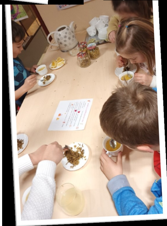
IZDELOVANJE MILNIH MEHURČKOV IN PRIPRAVA ČAJA